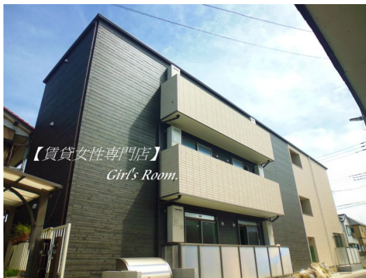
【賃貸女性専門店】 Girl's Room.